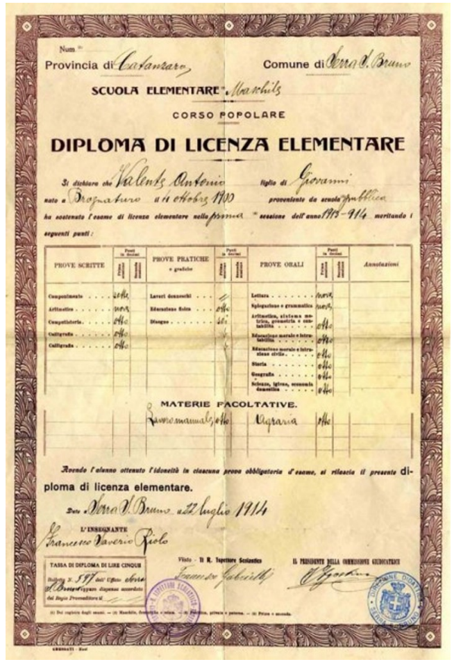
LA VALUTAZIONE NELLA SCUOLA PRIMARIA COSA È CAMBIATO